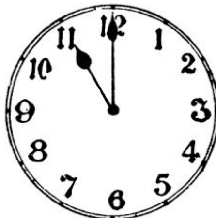
Slika sata iz prvog primjera prije i poslije bacanja čarolije